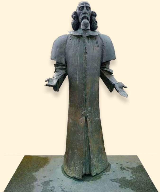
Johann Amos Comenius